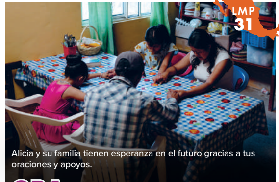
Alicia y su familia tienen esperanza en el futuro gracias a tus oraciones y apoyos.

*Nombre cambiado para protegerla a ella y a su familia.