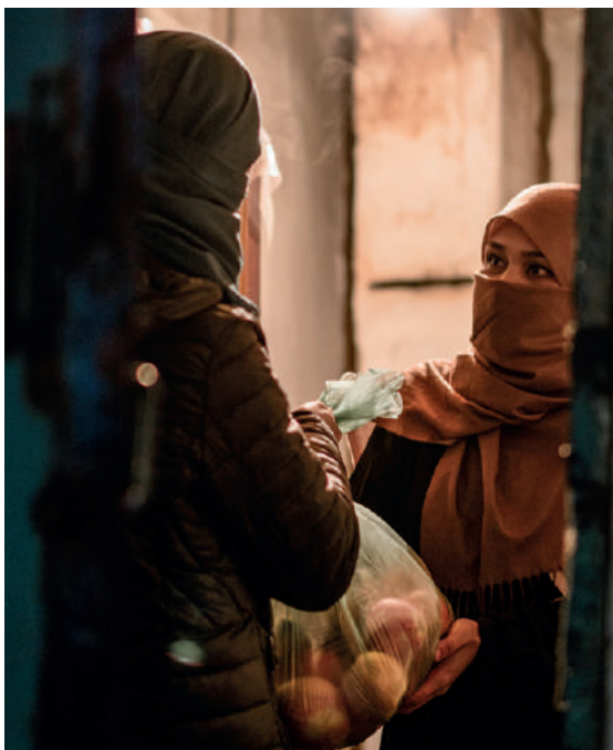
Envía ayuda práctica de subsistencia a cristianos clandestinos como Khada.

*Nombres cambiados por motivos de seguridad