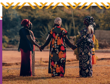
Miles de cristianos perseguidos han encontrado restauración y esperanza en el centro de atención postraumática de Puertas Abiertas.

80 € podrían ayudar a un cristiano perseguido a comenzar un negocio que le dé seguridad económica.